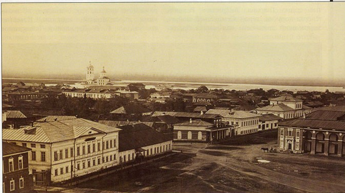
Иркутск. Вид с Тихвинской колокольни на Тихвинскую площадь. 1865 год

Г. Р. Державин входил в одну придворную группировку с Платоном Алексеевичем Зубовым, поэтому Н. П. Резанов перешел на службу к Зубову секретарем и по поручению тогдашнего фаворита императрицы в марте 1794 года отправился в Иркутск. Как мы помним, там проживал отец Резанова, с которым тот давно не виделся, поэтому не исключая, что Николай Петрович сам вызвался ехать. О цели поездки он писал следующее: по прошению Г. И. Шелихова и его компаньона И. И. Голикова в колонию на Аляске