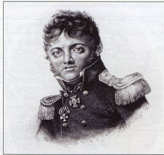
Николай Петрович Румянцев. Гравюра Л. Хориса с картины О. Кипренского. Около 1821 года

будет человек, никогда не видавший моря!