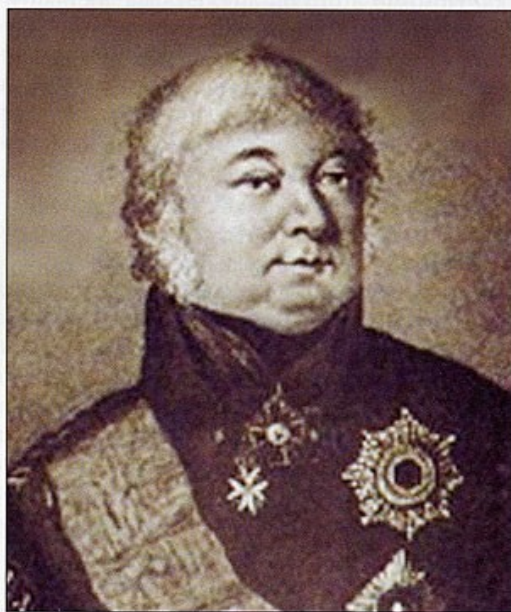
Александр Андреевич Беклешов.

и торговлю сроком на двадцать лет 9 . Она не могла обанкротиться. Защиту ее интересов (в том числе и военную) на международной арене брало на себя государство. Поэтому обычной на первый взгляд торгово-промышленной компании, каких в Сибири действовало несколько, удалось оставить столь заметный след в истории — и не только российской. Главная заслуга РАК заключалась в том, что она смогла взять на себя функцию колониальной администрации на огромной территории североамериканского континента. «Если бы в колониях было установлено коронное управление, то любой конфликт мог легко превратиться в вооруженное столкновение с иностранными державами. Иначе обстояло дело, если бы те же задачи осуществляла коммерческая компания. Возможность дипломатических осложнений при этом была значительно меньше: правительство всегда могло остаться в стороне и объяснить то или иное столкновение деятельностью купцов, действовавших за собственный риск и страх» 10 .