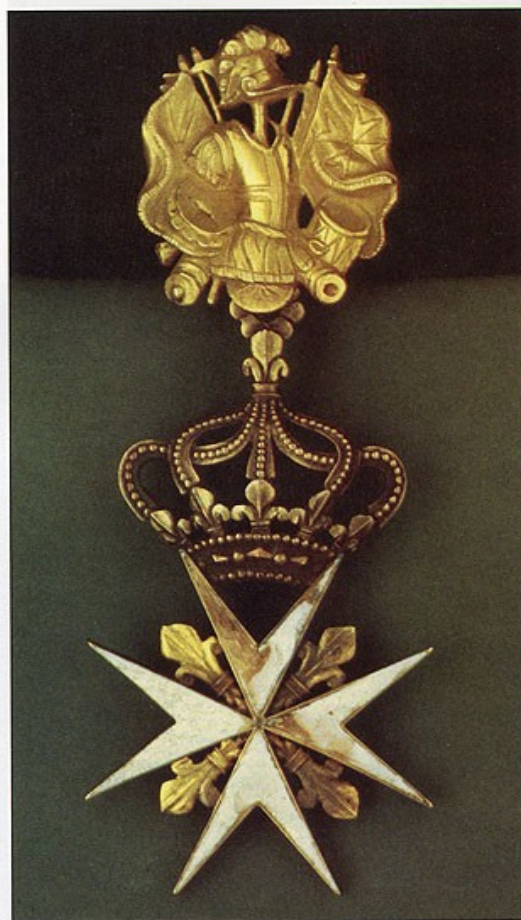
Командорский крест ордена святого Иоанна Иерусалимского 2-й степени