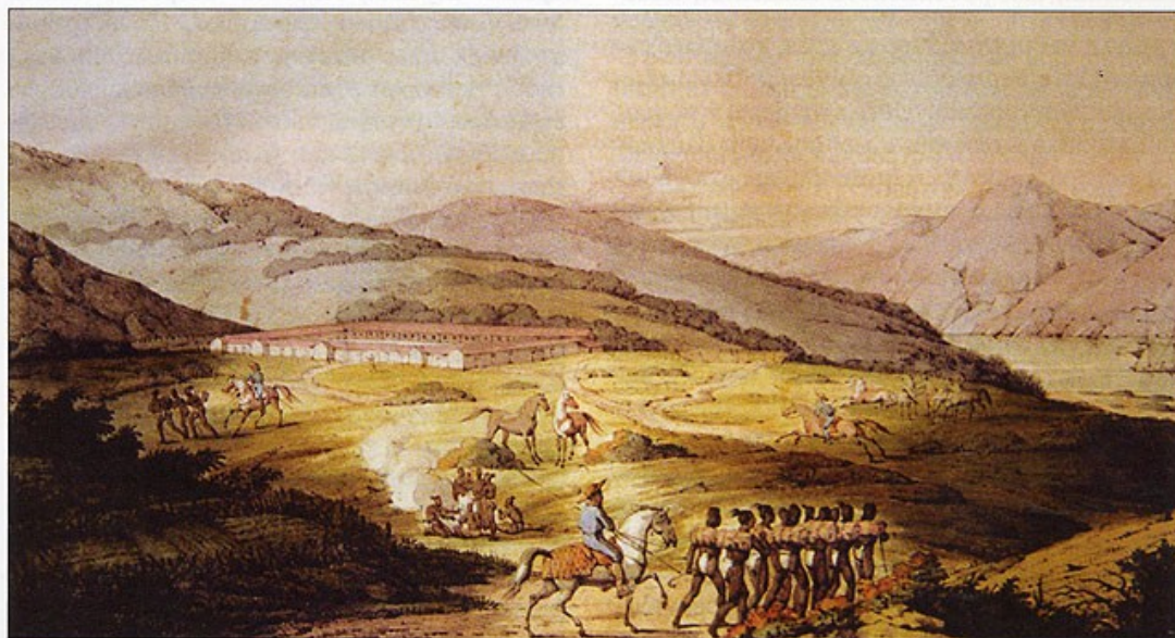
Вид президио (военной базы) Сан-Франциско.