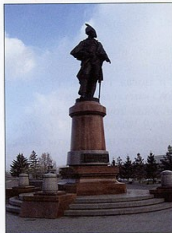
Памятник Н. П. Резанову в Красноярске

9 июня 2007 года в Красноярске открыли грандиозный мемориальный комплекс в память о Николае Петровиче Резанове. Бронзовое изваяние Резанова в форме и при шаге установлено на мраморном постаменте. Здесь же гранитный глобус с маршрутом первой русской кругосветной экспедиции и две плиты, символически изображающие корабли «Юнону» и «Авось». Смотришь на памятник и невольно возникает вопрос: а кому он поставлен — действительному камергеру Резанову или мифическому герою рок-оперы?..