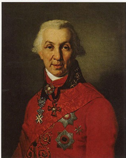
В. Л. Боровиковский. Портрет Г. Р. Державина. Холст, масло. 1811 год