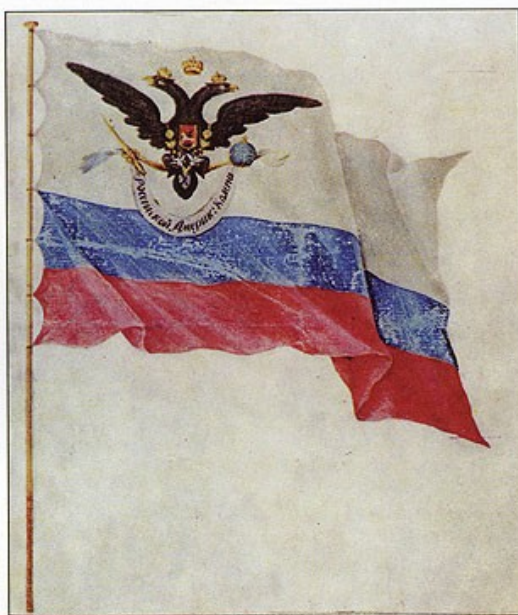
Флаг Российско-Американской компании

11 марта 1801 года заговорщики убили императора Павла I. На престол вступил Александр I. Практически все участники заговора