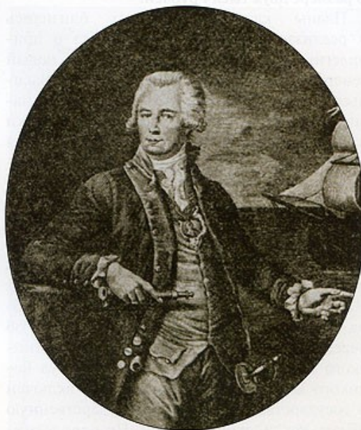
Григорий Иванович Шелихов. Гравюра В. Иванова. 1795 год

лихова проекты при покойной императрице лежавшие «под сукном».