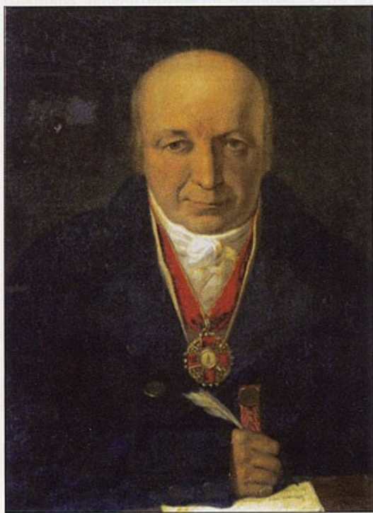
М. А. Тиханов. Портрет А. А. Баранова. Холст, масло. 1819 год