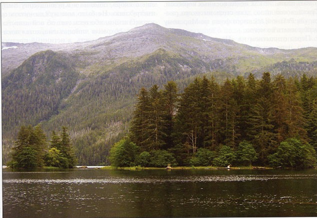
Аляска. 2010 год

О Резанове как главном руководителе экспедиции и подчинении ему офицеров речи не было. Однако 10 июля Александр I утверждает довольно противоречивую инструкцию Румянцева Резанову в связи с плаванием последнего в Русскую Америку 19 . В первом пункте инструкции говорится о подчинении судов и офицеров Резанову, а во втором — что право командования судами дано Крузенштерну. Но командование кораблями без подчинения офицеров невозможно. Указанное противоречие привело к серьезному конфликту между Крузенштерном и Резановым. До Крузенштерна инструкцию не довели, он о ней ничего не знал и поэтому считал себя начальником