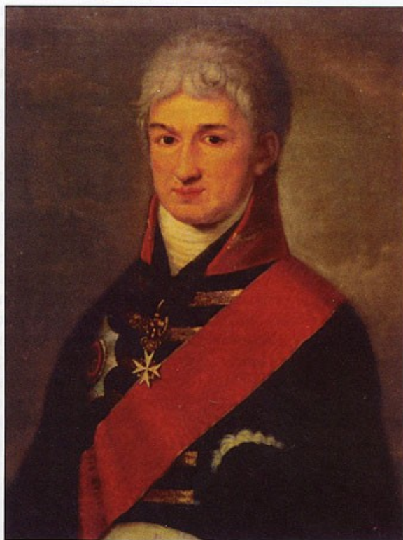
Неизвестный художник. Портрет Николая Петровича Резанова. Холст, масло. Начало XIX века

Художественный образ и историческая личность